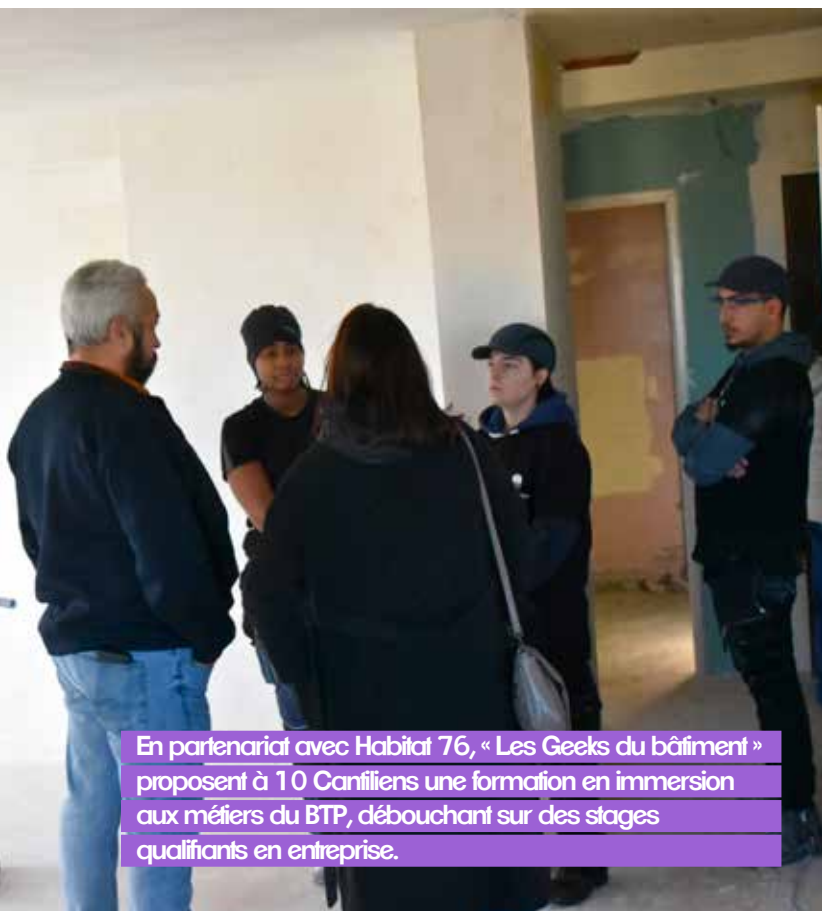
En partenariat avec Habitat 76, « Les Geeks du bâtiment » proposent à 10 Cantiliens une formation en immersion aux métiers du BTP, débouchant sur des stages qualifiants en entreprise.