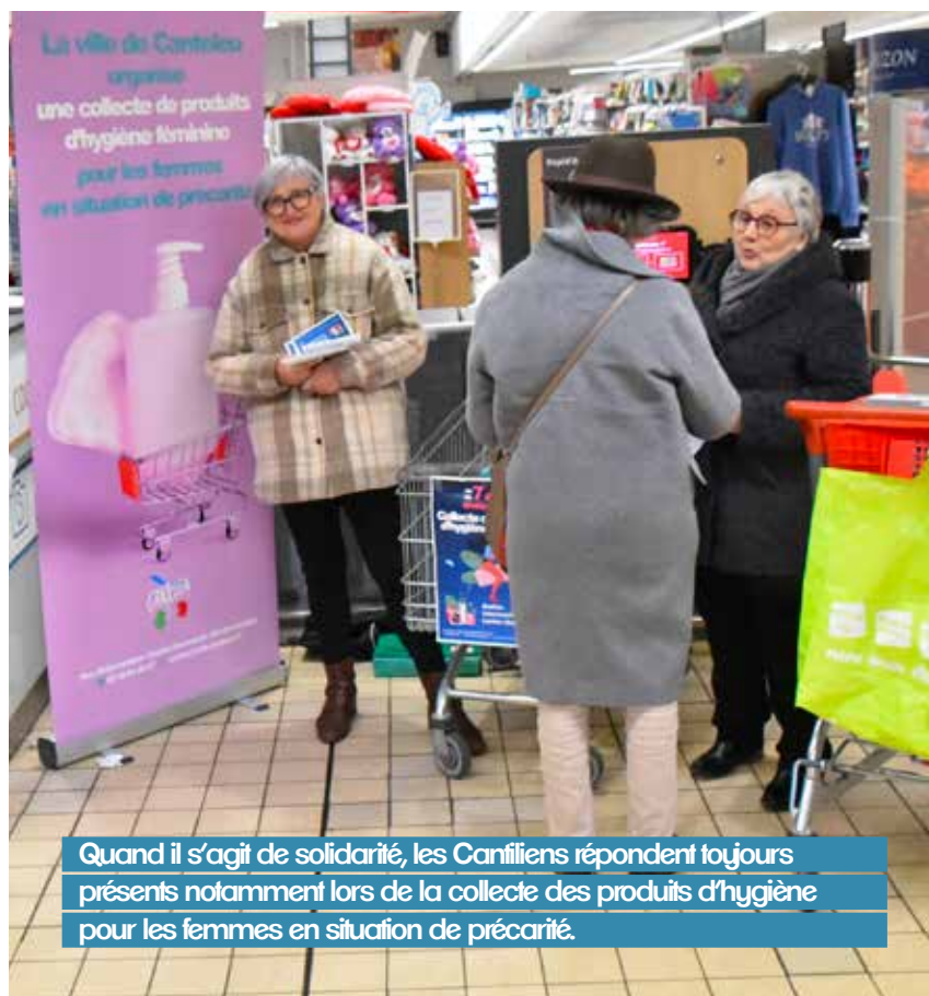
Quand il s'agit de solidarité, les Cantiliens répondent toujours présents notamment lors de la collecte des produits d'hygiène pour les femmes en situation de précarité.