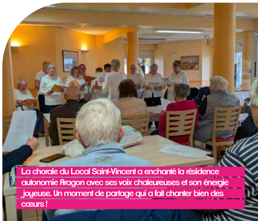
La chorale du Local Saint-Vincent a enchanté la résidence autonomie Aragon avec ses voix chaleureuses et son énergie joyeuse. Un moment de partage qui a fait chanter bien des cœurs !