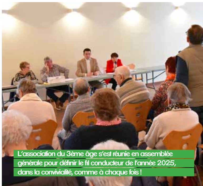
L'association du 3ème âge s'est réunie en assemblée générale pour définir le fil conducteur de l'année 2025, dans la convivialité, comme à chaque fois !