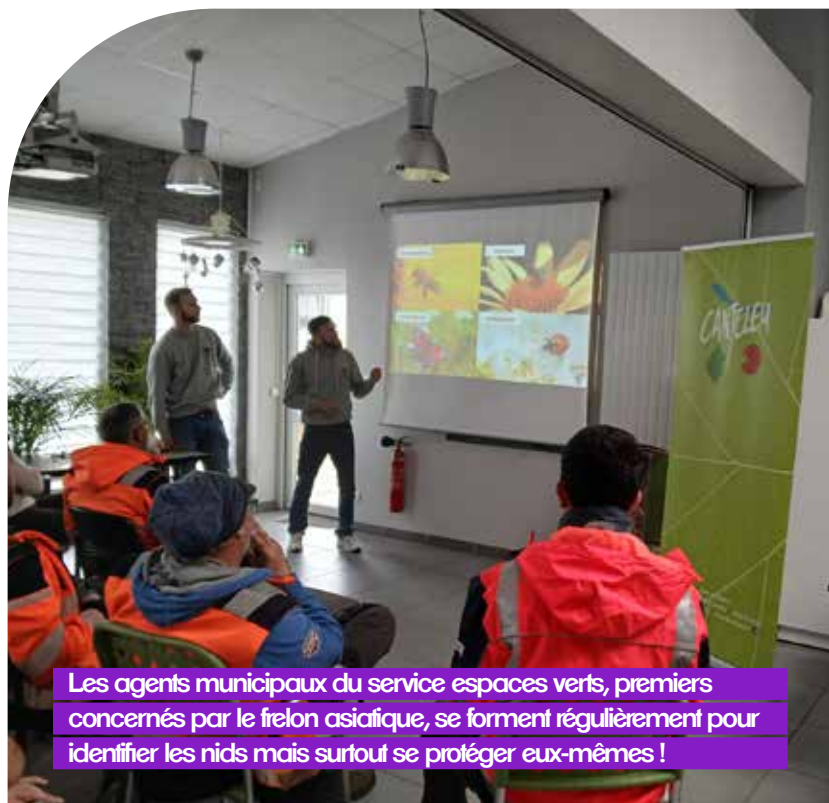
Les agents municipaux du service espaces verts, premiers concernés par le frelon asiatique, se forment régulièrement pour identifier les nids mais surtout se protéger eux-mêmes !