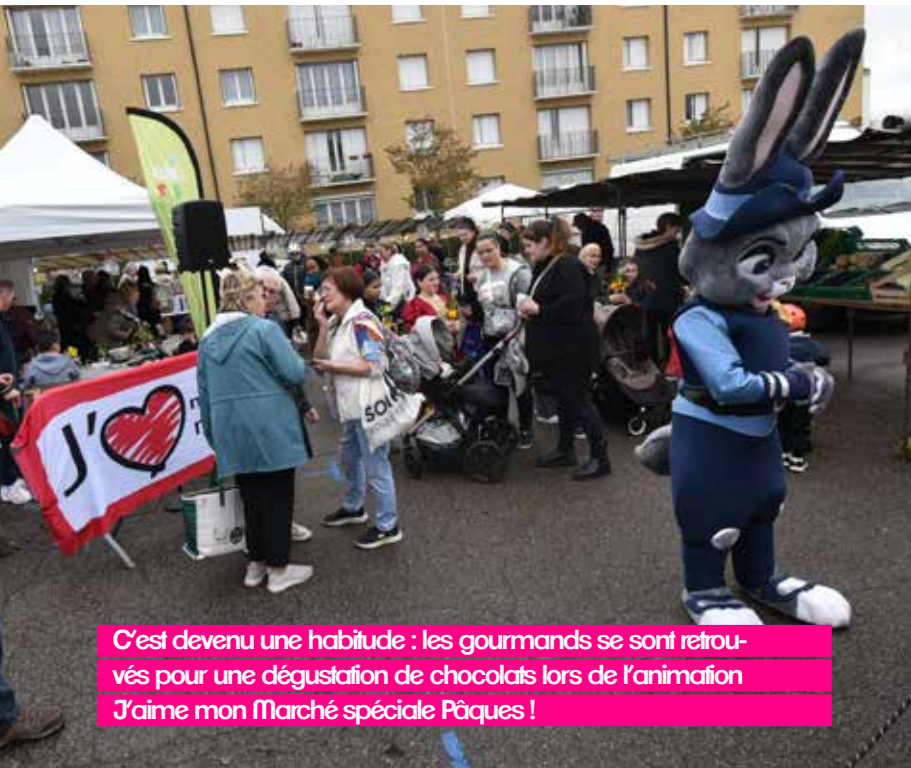
C'est devenu une habitude : les gourmands se sont retrouvés pour une dégustation de chocolats lors de l'animation J'aime mon Marché spéciale Pâques !