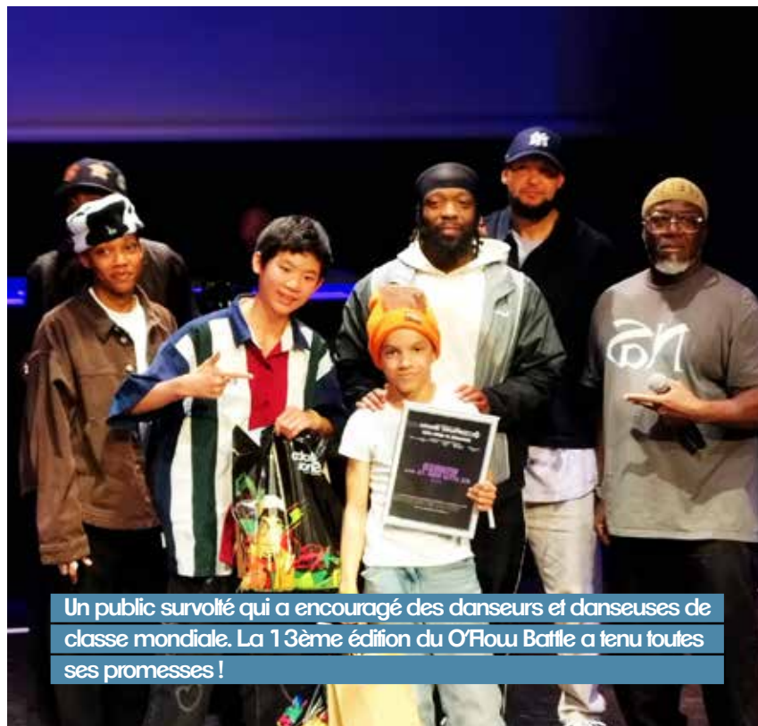
Un public survolté qui a encouragé des danseurs et danseuses de classe mondiale. La 13ème édition du O'Flou Battle a tenu toutes ses promesses !