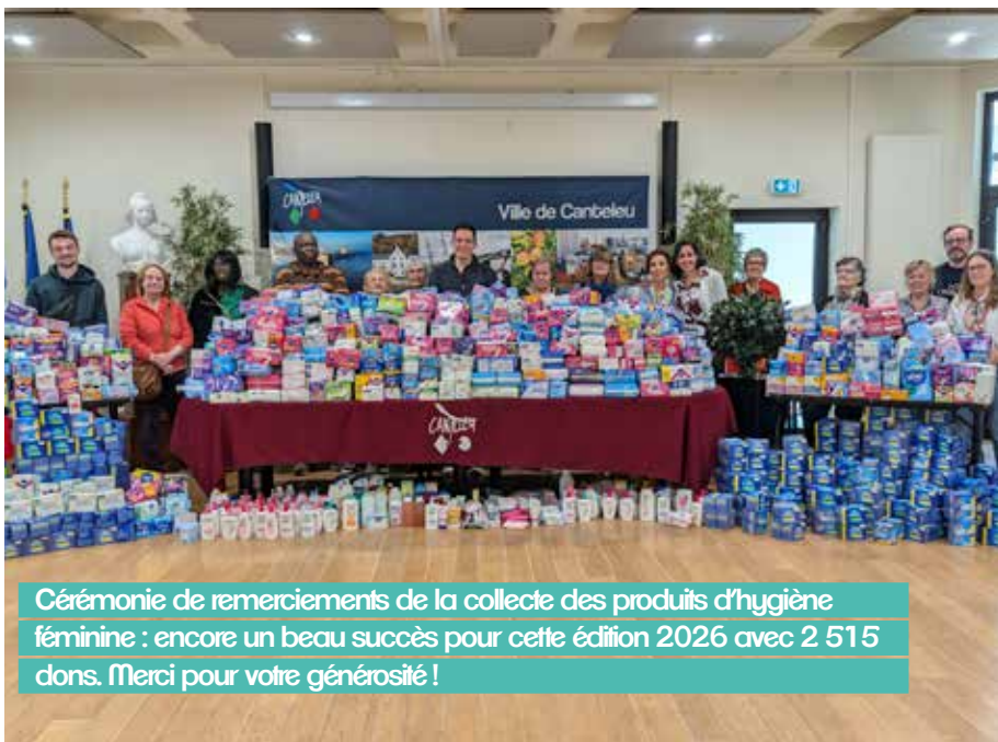
Cérémonie de remerciements de la collecte des produits d'hygiène féminine : encore un beau succès pour cette édition 2026 avec 2 515 dons. Merci pour votre générosité !