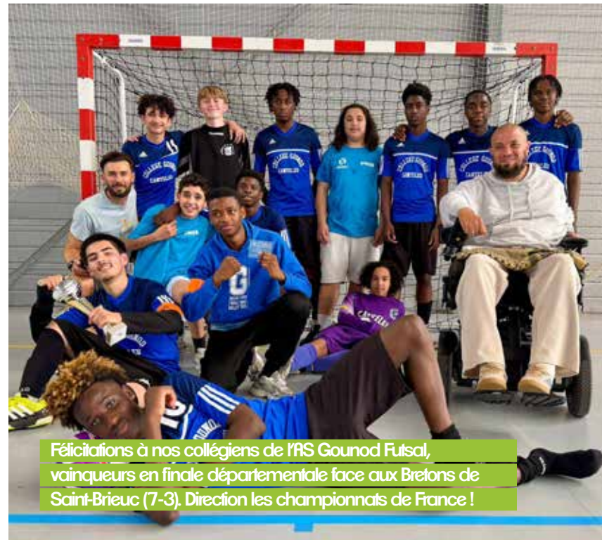
Félicitations à nos collégiens de l'AS Gounod Futsal, vainqueurs en finale départementale face aux Bretons de Saint-Brieuc (7-3). Direction les championnats de France !