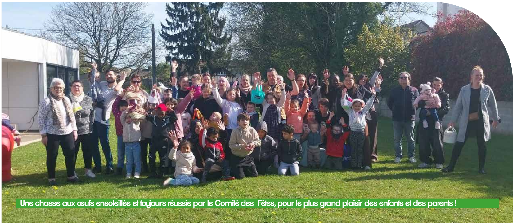
Une chasse aux œufs ensoleillée et toujours réussie par le Comité des Fêtes, pour le plus grand plaisir des enfants et des parents !